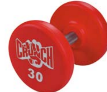
Вес, кг 2-70, шаг 2 кг