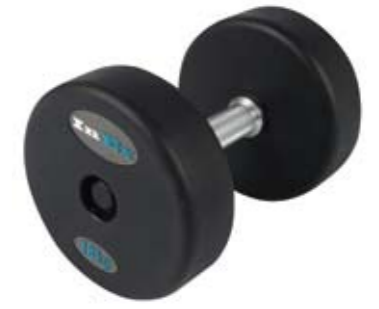
Вес, кг 12-46, шаг 2 кг