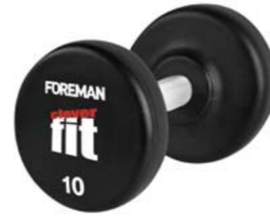
Вес, кг 2-70, шаг 2 кг