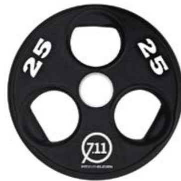
Вес, кг 1,25 / 2,5 / 5 / 10 / 15 / 20 / 25